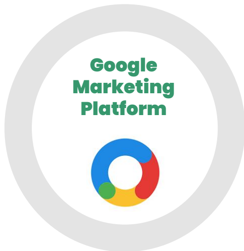
Search Ads 360